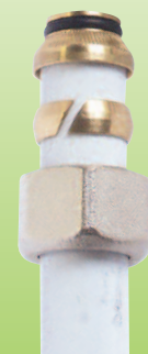
Sur tube Multicoche

La solution 3/4EK pour adaptation sur tout type de tube